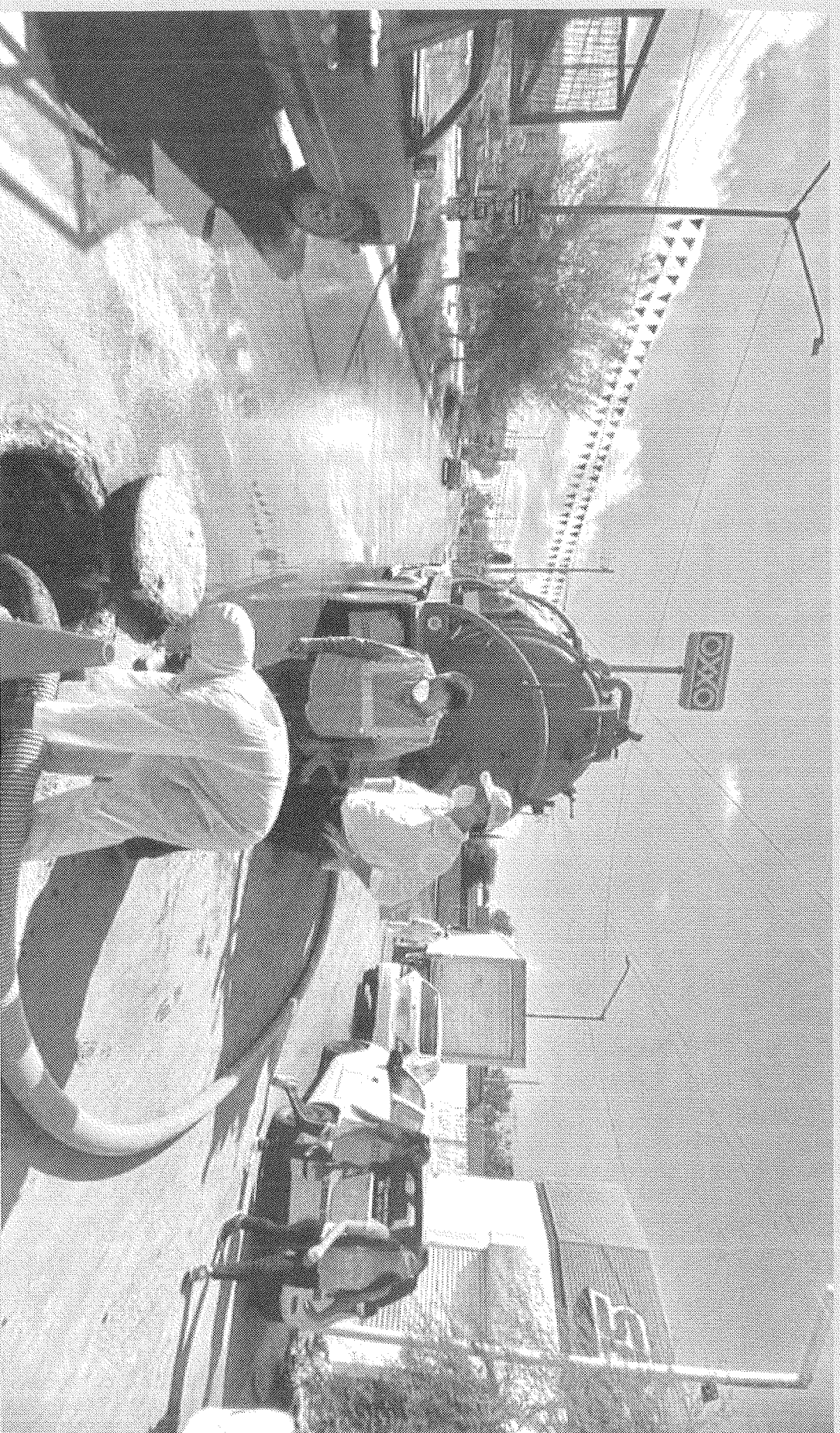
El Alcalde atiende de manera personal los reportes de los vecinos.

Ya sea una tala de árbol seco, una obstrucción en el drenaje, la caída de una barda, entre otros reportes, el municipio se da a la tarea de seguir trabajando intensamente para tener un mejor municipio para sus gobernados.