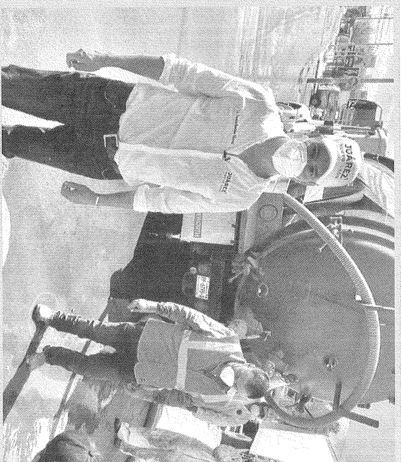
Everardo Benavides, alcalde de Juárez, responde rápido a las peticiones.

necesario con el objetivo de buscar y encontrar una solución a esta problemática que afecta a muchas colonias de nuestro municipio", señaló.